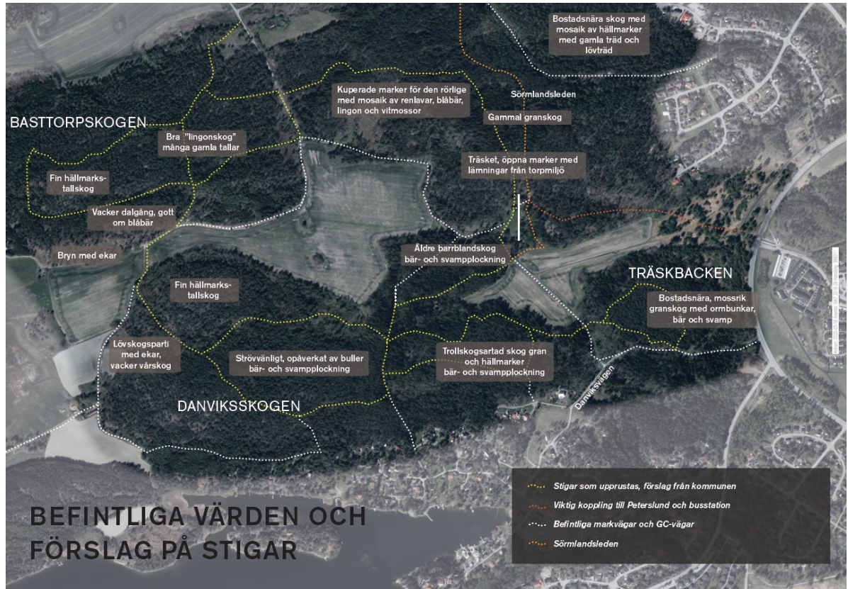
Bild 1 – Befintliga stigar rustas. Stigen längst åt öster (orange) är Sörmlandsleden.