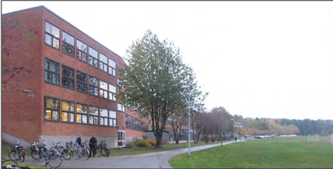
Breviksskolan sedd ifrån sydväst, med Frösängs gårde till höger. Skolbyggnaden bidrar till att rama in det långsträckt gärdet. Fotodatum: 21 oktober 2016.