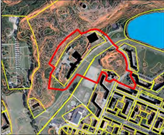
Ungefärligt planområde markerat med rött.