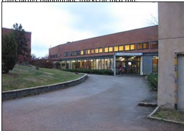
Breviksskolans entré från väster. Foto från 2016.