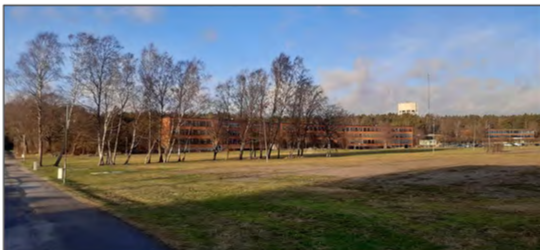
Breviksskolan sedd ifrån sydöst, med Frösängs gårde i förgrunden. Skolbyggnadernas volymer är känsligt inpassade i terrängen, där Campus syns till höger. Fotodatum: 8 januari 2020.