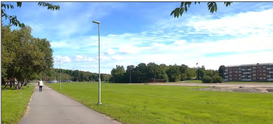
Frösängs gårde ifrån sydväst, med kullen "Lillis" i mitten och en dagvattendamm och Z-huset till höger i bild. Fotodatum: 30 augusti 2023.